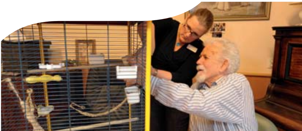
Genieten van het gezellige getjilp van parkieten in de volière

Voor mensen met (matige tot zware) dementie heeft Bernardus een speciale snoezelruimte, met snoezelbed en snoezelbad. Snoezelen is een benaderingsvorm die inhaakt op de zintuigen en waarmee medewerkers contact proberen te krijgen met de belevingswereld van de demente mens.